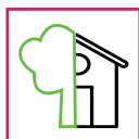
Indoor / Outdoor